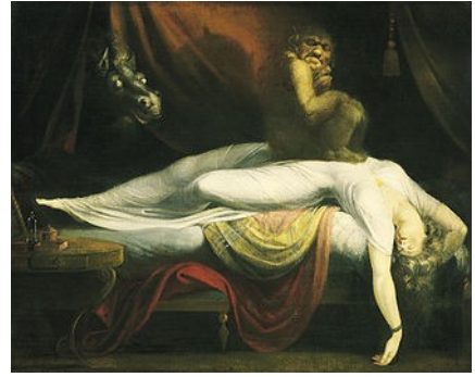
«Koshmaro», Henry Fuseli, 1781