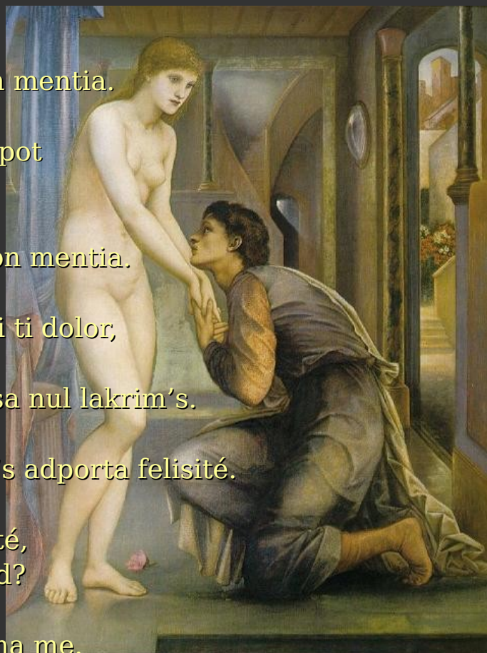
Sir Edward Burne-Jones. Pigmalion e skulptura: resiva anima, 1879

nam kvalim on pot dira tanti mentia's al person, ki-em on ama?