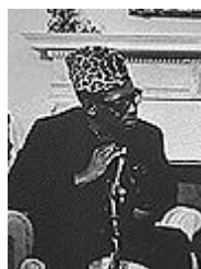
Li dictator Mobutu

Li colonias totalmen ne esset preparat por li índependentie. Li europans demisset les in li índependentie quande li mantention de lor administraciones e lor representantes in Africa devenit tro custosi. Li population local ni hat obtenet un sufficient education ni aprendet reciproc respecte. Ili nequande experit nequó altri quam li jure del plu forto. E anc pos li índependentie to continuat. In Congo sequet li brutal dictatura de Mobutu Sese Seko. Belgia e li Unit States subtenet Mobutu in venir al potentie. Con li consente di tis du países Lumumba esset mortat anc pro to que il subtenet in li Frigid Guerre li Soviet-Union. Pos li era de Mobutu li habitantes de Congo esset tormentat de guerres pri li ressurses e pri li hegemonie in li region.