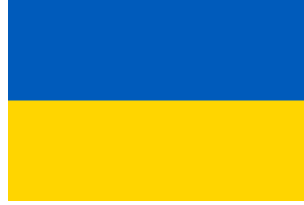
Li flagge de Ucraina

Per li disruption del Soviet-Union li Ucraina ha atinget li estatal índependentie, quel it ne hat serchat. Ínterim li identification del pópul con li nov patria ha devenit fort, etsí li land es surprisant heterogen.