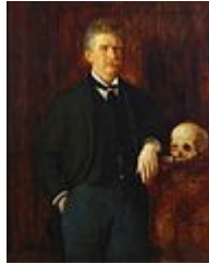
Un portrete de Ambrose Bierce

Ambrose Brose es hodie considerat quam un del fundatores del modern horrore-litteratura juntmen con li plu conosset scritores Edgar Allan Poe e H.P.Lovecraft.