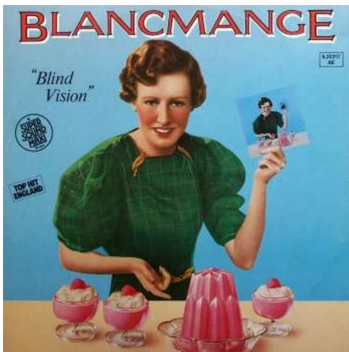
Li covriment del disco "Blind Vision"

Ci es un traduction del canzon "Blind Vision" (Ciec Vision) del anglesi gruppe Blancmange. Blancmange esset un populari gruppe inter 1982 e 1985. Li musical style esset li electronic pop-musica de New Wave.